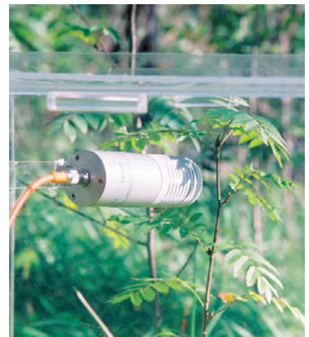
Die GMP343 ist ideal für Bodenatmungsmessungen geeignet. Die Konstruktion mit Diffusionsaspiration benötigt keine Probenahmesysteme und vermeidet Messfehler, die durch Druckdifferenzen bei Pumpen entstehen.

Die Messdaten der GMP343 sind linearisiert und werden mit Referenzgasen der Klasse ±0,5 % kalibriert. Bei Bedarf lässt sich die Sonde durch den Anwender mit genaueren Gasen neu kalibrieren, indem die Mehrpunkt-Kalibrierfunktion (MPC) verwendet wird, die bis zu 10 benutzerdefinierbare Kalibrierpunkte bereit stellt.