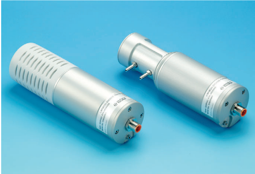
Die GMP343 ist ein kompaktes Feldmessgerät für allgemeine CO 2 -Umweltmessungen